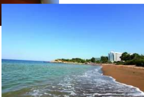
Longue plage de sable fin