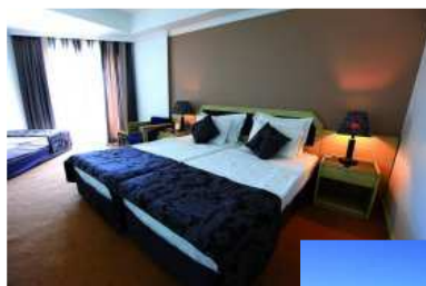
Chambres spacieuses avec balcon

Forfait tous tournois et animations : 100 € la semaine - 180 € les deux semaines