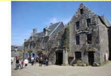
Un but d'excursion : Locronan